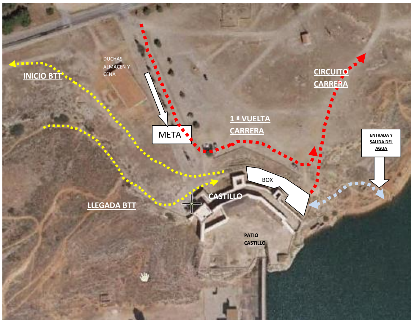
Ubicación boxes, acceso y salida del agua así como inicio y final de los diferentes recorridos.

Los boxes estarán situados en la zona de la muralla del Castillo de Peñarroya. Se aprovechará este espacio para poder situar las bicicletas de los triatletas.