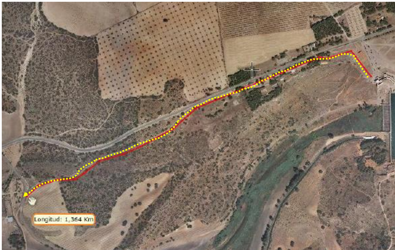
Primer tramo de bajada, senda estrecha y técnica.

Todo el recorrido se realiza por caminos públicos, a excepción de la senda de inicio, que discurre por una finca particular, para evitar tener que ocupar la carretera. Senda estrecha y algo técnica, de dificultad media.