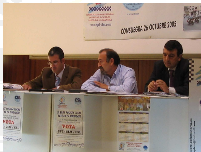
Servicios Jurídicos con Presidente Regional