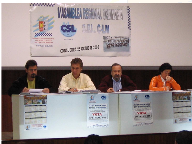
Comisión Permanente del Sindicato

Así mismo, como viene siendo habitual en años pasados, con el fin de colaborar a la financiación de los gastos del Sindicato, se hizo entrega de los talonarios de Lotería Nacional del número 60566 que jugamos para el sorteo de Navidad, talonarios de 25 papeletas en participaciones de 5 € cada una, de los cuales 4 € son de participación de lotería y 1 € de colaboración con el Sindicato, habiendo reservado 18.000 € en la Administración de Lotería nº 17 de Albacete, la cual se irá retirando de la Administración e ingresando en la sucursal 4438 de Caja Madrid en Albacete (donde tiene la cuenta el Sindicato) conforme se ingrese el dinero de la venta.