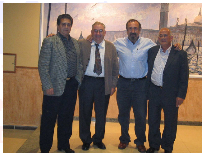
Reconocimiento jubilados 2005 con Presidente Regional